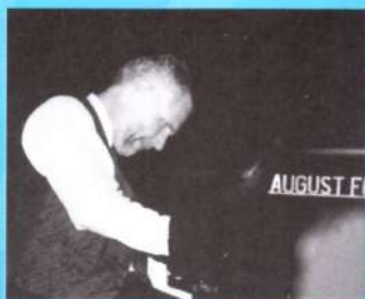
Арт-директор фестиваля, заслуженный артист России

После выступлений в США журнал "DOWN BEAT" назвал его музыку: "... прекрасным, не замкнутым в себе русским авангардом, где Эрл Гарнер не противоречит Сесил Тейлору."