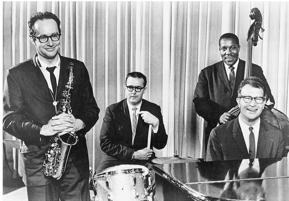
• Квартет Дейва Брубeka

Позже музыканты вернулись к мелодии и довели ее до кондиции, чтобы записать на готовящийся диск Time Out . Но, поскольку пьеса так и не получила названия, вспомнили момент ее рождения и оставили с названием Take Five , в буквальном переводе – «Возьми пять». Композиция была написана в непри-